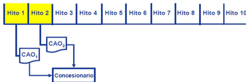
Gráfico 1: expedición de CAO por cada hito 10

Al término de cada hito, la Sociedad Operadora recibirá un CAO, que acredita el cumplimiento de un determinado hito y genera el derecho a recibir un pago, bien sea del Pago por Avance de Obra (“PAO”), bien sea de la Retribución Anual por Inversión (“RPI”) 11 , que son montos dinerarios, de acuerdo a la estructura de cada contrato de APP. Por su parte, los CRPAOs y CR-RPIs constituyen certificados de reconocimiento de derechos (acreencias) sobre los PAO y los RPI derivados de cada CAO expedido, respectivamente.